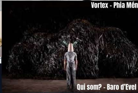
Qui som? - Baro d'Evel