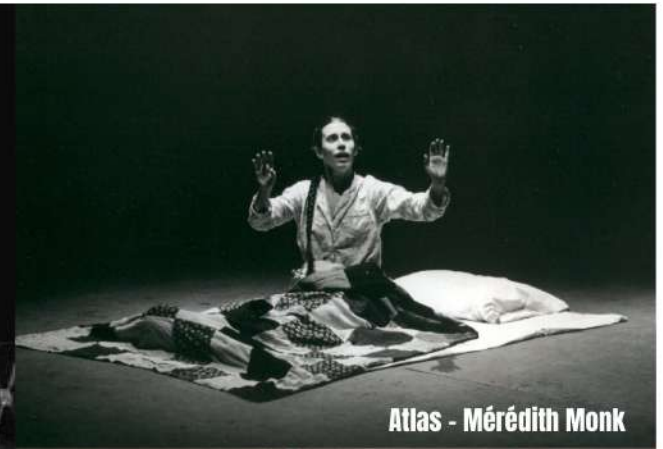
Atlas - Mérédiith Monk