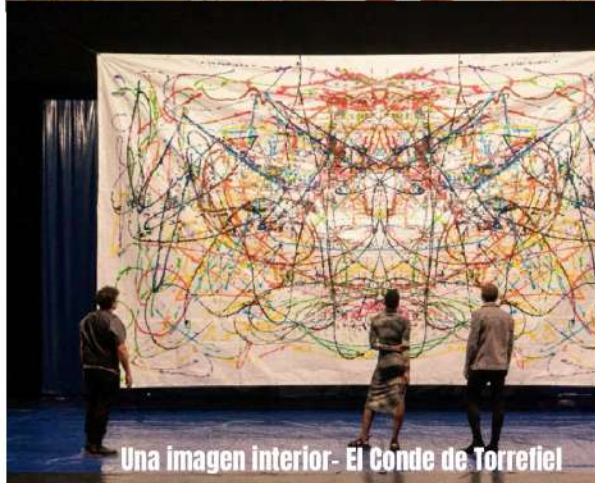
Una imagen interior - El Conde de Torrefiel