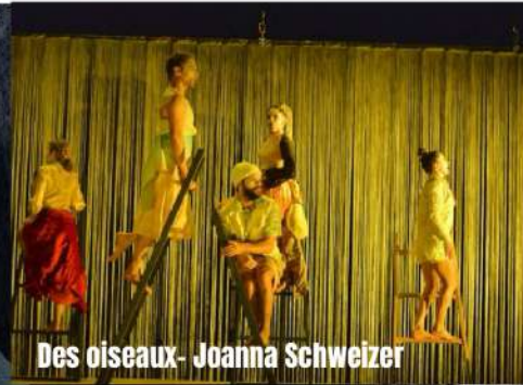
Des oiseaux - Joanna Schweizer